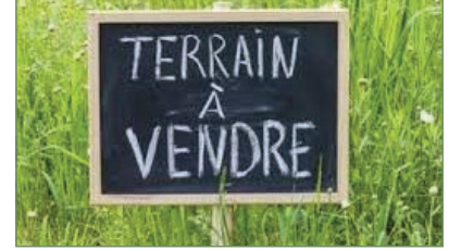
PIERREFITTE-SUR-SEINE. Beau terrain de 230m 2 constructible. 5 Boxes sur la parcelle à détruire. A 15 Min à pied de la gare de PIERREFITTE. - 175 000 €