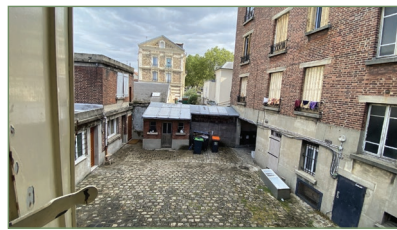
PIERREFITTE-SUR-SEINE. Bas Butte Pinson, dans un immeuble ancien, au 1 er étage sur cour, grand F2, vendu loué, composé d'un beau séjour avec cuisine ouverte, une chambre avec placard, un dégagement avec salle d'eau et WC. 132 000 €