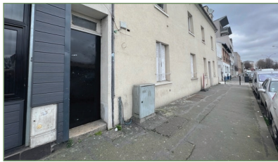
STAINS. F2 proche CARREFOUR d'une superficie de 27m 2 . Composé ainsi : Entrée, séjour avec cuisine ouverte, salle d'eau, WC. Faible charges. 107 000 €