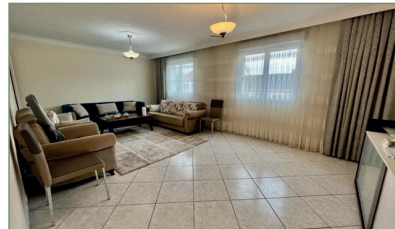
PIERREFITTE-SUR-SEINE. Beau pavillon d'une superficie d'environ 160m 2 sans travaux proche de la gare. Construction solide et récente de 2010. Composé ainsi : Sous-sol total avec garage et cuisine d'été. Rez de chaussé : Entrée, grand séjour, cuisin séparée, chambre, WC. 1 er étage : quatre chambres, WC, salle de bains. Aucun travaux à prévoir. 462 000 €