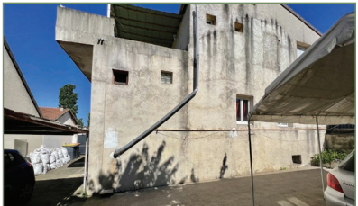
GARGES-LES-GONESSE. Maison 110 m 2 - 6 pièces - Pavillon divisé en deux lots. Situé dans le secteur recherché de la LUTECE. Possibilité de garer plusieurs véhicules. Le tout sur une parcelle de 198m 2 . Idéal investisseur. - 324 000 €