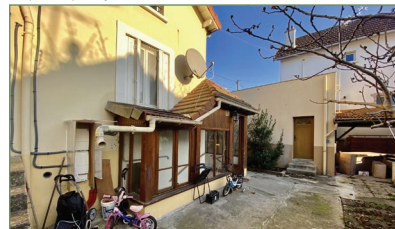
STAINS. Beau pavillon situé dans le secteur recherché de l'AVENIR. Pavillon divisé en plusieurs lots. Garage. Le tout sur une parcelle de 245m 2 . - 279 000 €