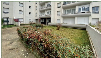
GARGES-LES-GONESSE. beau F3 de 72m 2 refait à neuf. Situé au 3 e étages il est composé ainsi: Entrée, cellier, cuisine, séjour donnant sur balcon, deux chambres, salle de bains, WC. Parking en sous-sol. - 182 000 €