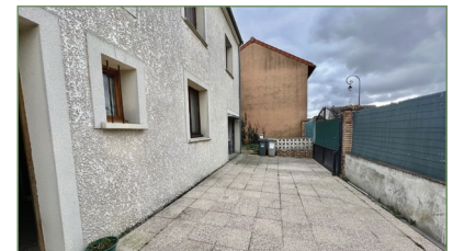
GARGES-LES-GONESSES. Beau pavillon, 4 pièces 100 m 2 , SECTEUR LA LUTECE composé ainsi : Entrée, cuisine ouverte sur séjour. À l'étage 3 chambres, salle de bains. Combles. - 310 000 €