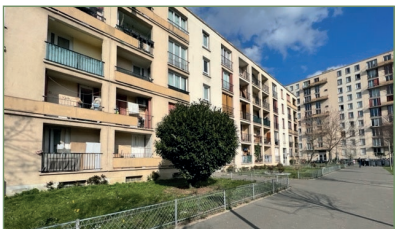
GARGES-LES-GONESSE. Beau F4 face à la gare. Composé ainsi : Entrée, séjour, cuisine, salle de bains, WC, 3 chambres. Place de parking extérieur. Cave. 192 000 €