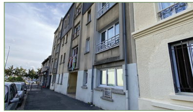
STAINS. Louis Bordes - Dans un petit immeuble, au 3 e et dernier ét., app. type F3 en DUPLEX, au rdc un beau séj. lumineux, une cuis. séparée et équipée, un WC, à l'ét. un dégagement avec placard, 2 ch. légèrement mansardées et une salle d'eau avec WC et douche à l'italienne. Aucun travaux à prévoir. Ce bien est complété par une place de parking en extérieur. - 163 000 €