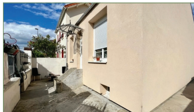
VILLETANEUSE. Beau pavillon sans travaux. Proche du tramway T5 et plusieurs lignes de bus. Entrée, séjour, cuisine, salle de bains, 2 ch. Grenier de 60m 2 aménageable. s-s total complètement aménagé. Deux dépendances à l'arrière de la maison. - 314 000 €